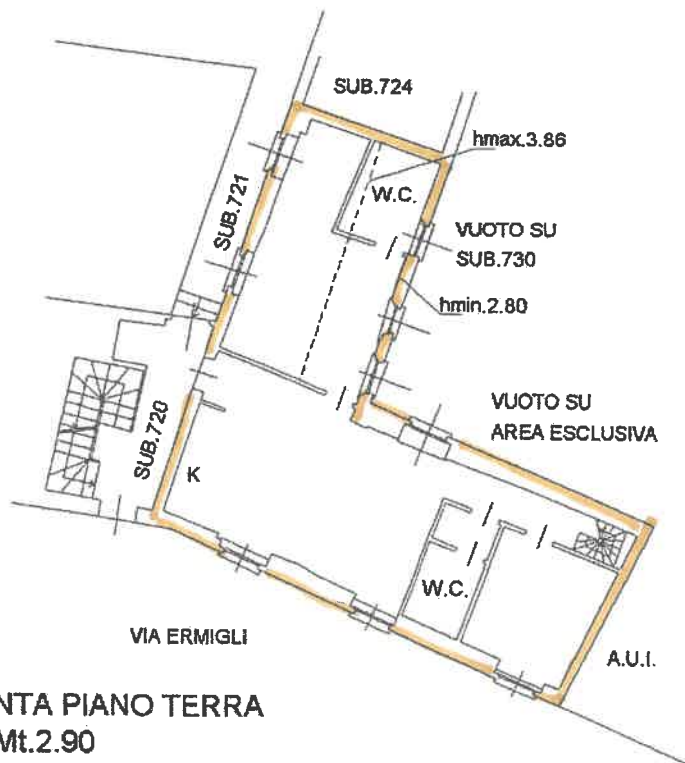
PIANTA PIANO TERRA H.=Mt.2.90